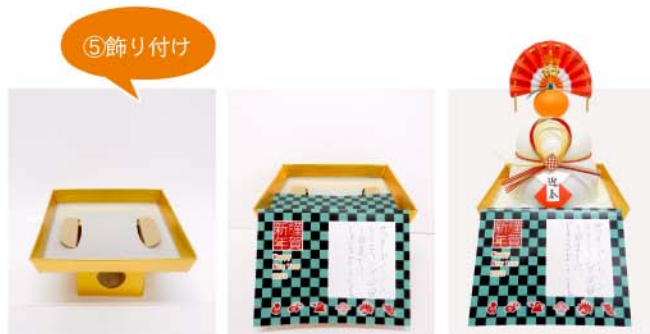
金三方を用意 ●●●●●▶ 前紙をセット ●●●●●▶ お餅をセット