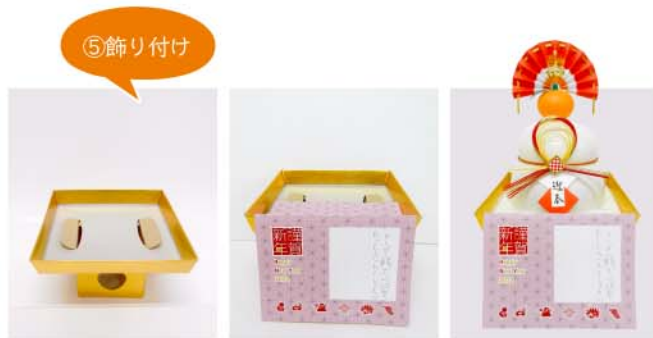
金三方を用意 ●●●●●▶ 前紙をセット ●●●●●▶ お餅をセット