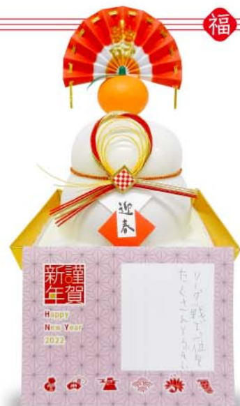
仕上がりイメージ